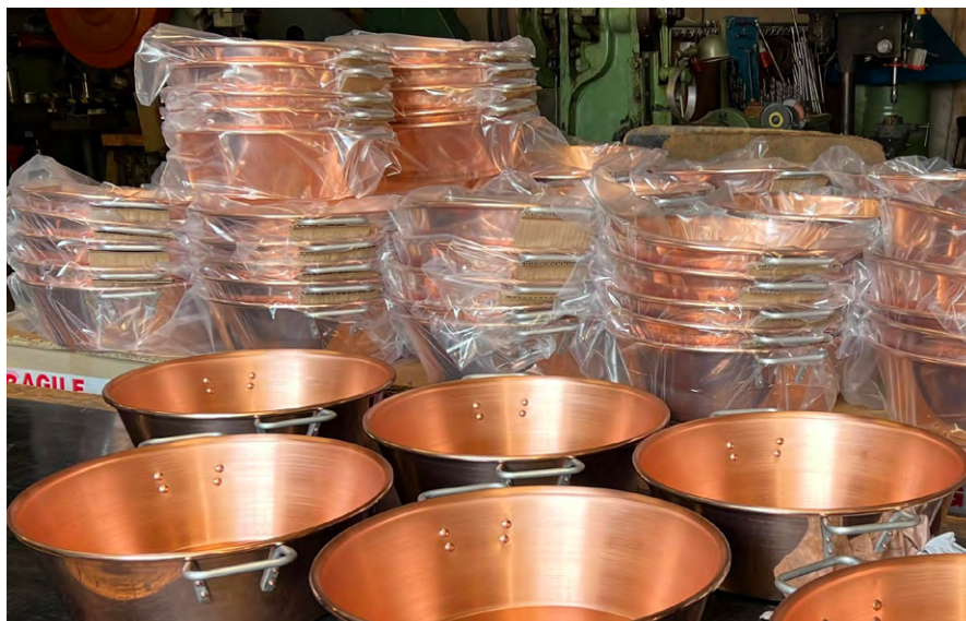
Brez fabrique notamment des bassines à confiture sur son site de Langeac.

Pour faire face à la concurrente asiatique, Brez privilégie les articles ménagers de qualité en aluminium et en cuivre, en complément de ceux destinés aux animaux d'élevage tels que les biberons pour veaux et agneaux. L'entreprise auvergnate, qui bénéficie du retour en grâce de la cuisine traditionnelle, met aussi ses moyens de production au service d'activités de sous-traitance dans la réalisation de