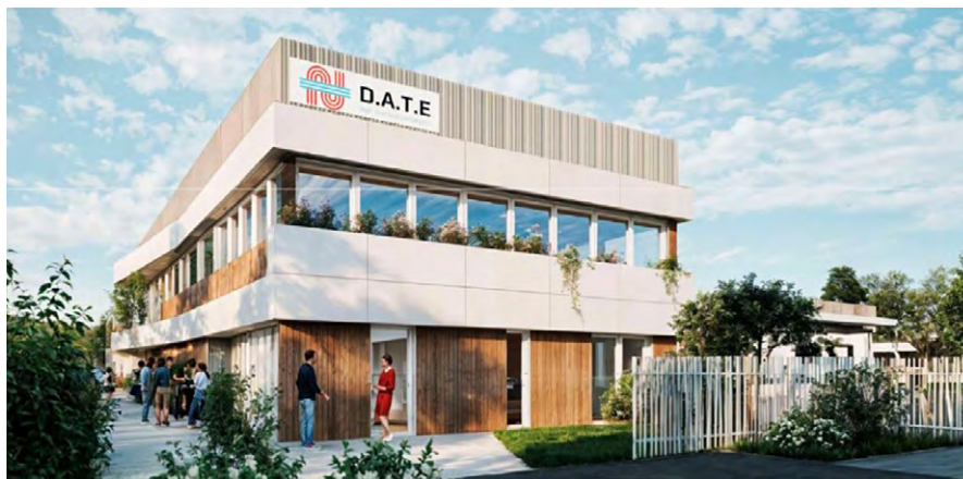
D.A.T.E. va se doter d'une nouvelle usine à Susville.

Le dispositif doit aider à identifier les points sensibles, comprendre les conflits d'usage et décider des actions à mettre en œuvre. Grâce à